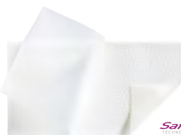
LÁMINA CON MICROADHERENCIA SELECTIVA