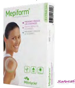
Lámina de silicona para el tratamiento de cicatrices hipertróficas y queloides