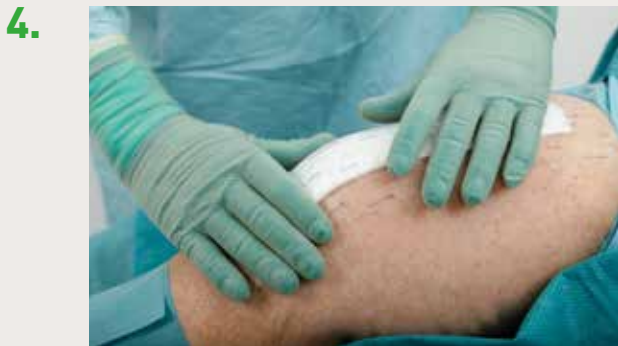
Lissez le pansement sur la peau périlésionnelle pour obtenir une bonne étanchéité et une adhérence optimale.