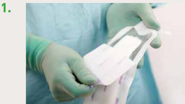
Retirez le pansement de son emballage stérile.