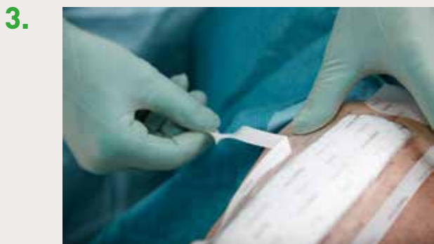
À l'aide de la languette, retirez le film protecteur restant sur le bord du pansement.