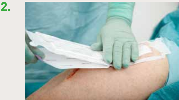
Enlevez le film protecteur entièrement ou partiellement et appliquez le pansement sur la peau.