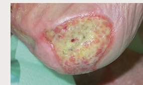
Escarre sur le talon