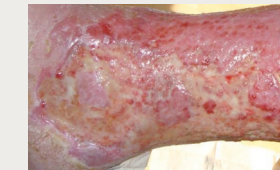
Ulcère de jambe mixte