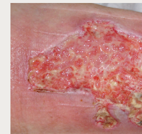
Ulcère de jambe mixte