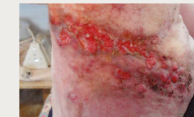
Tumeur ulcéreuse et réaction cutanée d'origine radique