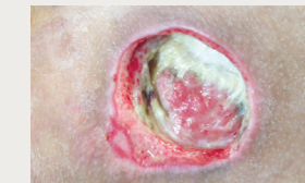
Ulcère du pied diabétique