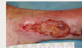
Ulcère de jambe veineux infecté